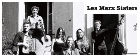
Les Marx Sisters

Les Marx Sisters ont choisi d'affirmer que le yiddish est une langue bien vivante dès lors qu'on la chante et qu'elle résonne dans le vibrato d'une clarinette, ricoche sur les touches de l'accordéon, frôle les cordes de la guitare et de la contrebasse et se déploie dans la grâce d'une voix envoûtante.