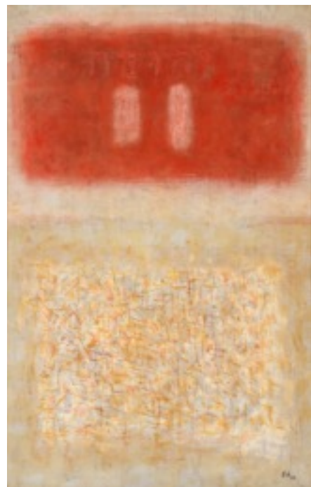
« Yehouda » 1963