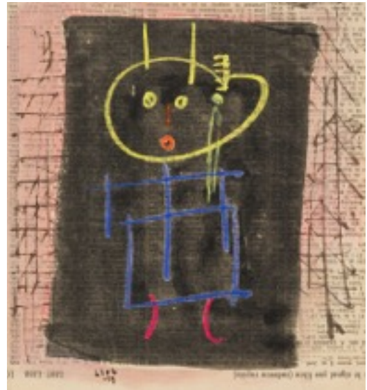
Sans titre sur papier journal, 1959

« Mon père en prière jouant de la clarinette »