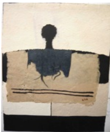
Pafilage (papier déchiré collé), sans date

Bibliothèque Polonaise de Paris 3 mai -2 juin 2017 « J'ai mis le jour dans la nuit »