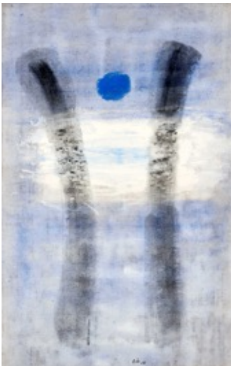
« Nephtali » 1963