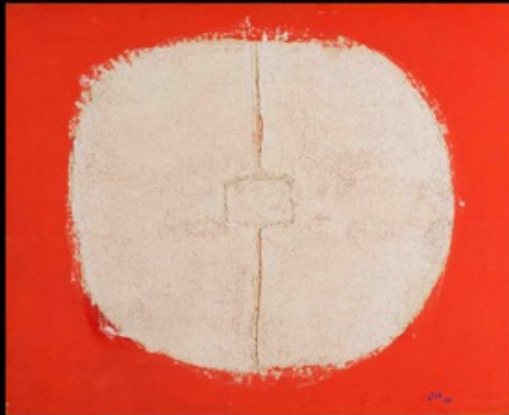
Thomas Gleb, sans titre, 1968. Collection particulière