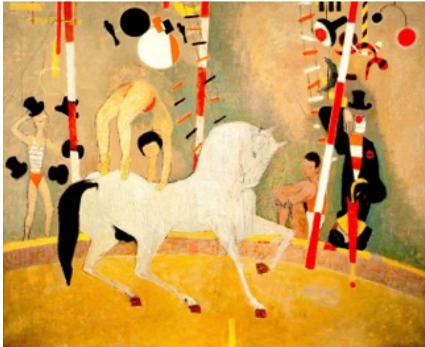
« Cheval blanc du cirque » 1955/56 Collection Musée d'Angers