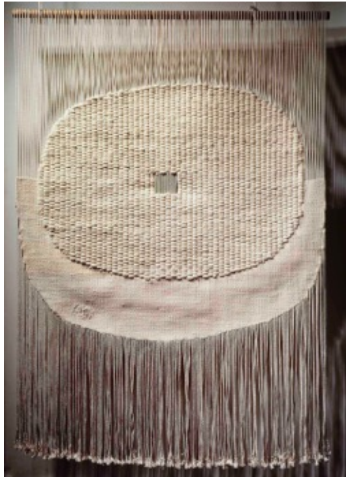
Tapiserie « Aimée » 1978